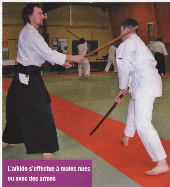
L'aïkido s'effectue à mains nues ou avec des armes